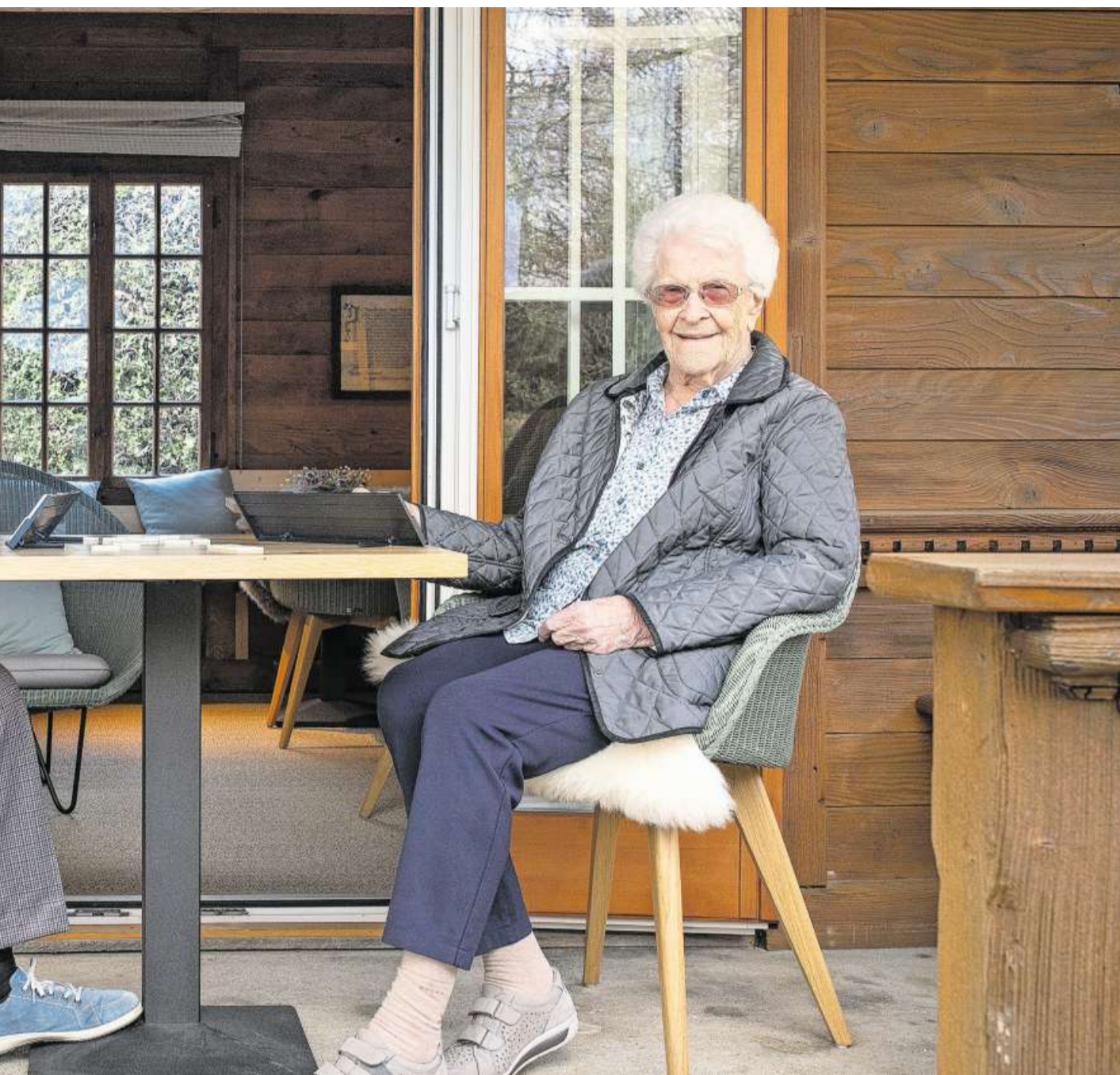
Blumenheim in Zofingen wieder viel einfacher von ihren Familien besucht werden.